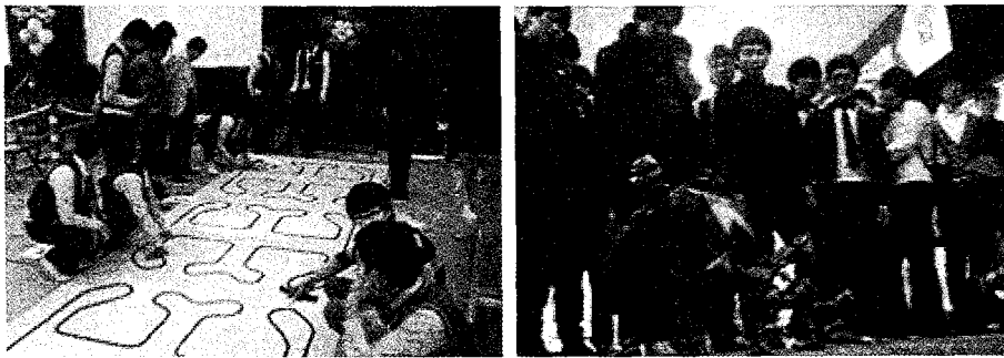
광양제철 연수반 이론실무 및 현장실습

전자자동화과 교수와 학생은 지역사회의 발전을 위하여 지역고교, 봉사단체, 보육단체에 무료로 로봇특강 실시함으로써 과학 꿈나무 양성을 위한 기술지원을 실시하고 있다. 이 봉사활동을 통하여 잠재력 있는 인재를 확보하고 우수인재로 육성함으로써 사회에 봉사하고 명품학과로 거듭 발전하고 있다. 이러한 노력으로 2010년 2학년 졸업생의 60% 정도가 대기업에 취업하였고, 2011년 졸업기준으로 100% 취업을 목표로 노력하는 명품학과로 발전하고 있다. KEA