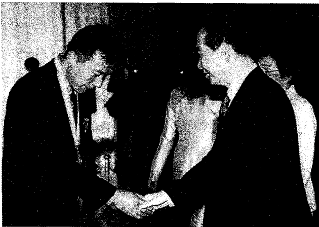
2002년 우수인재 대통령상 수상

국내외적으로 지구 환경문제가 심각히 대두하게 되면서 저탄소를 배출하는 대체에너지 사업의 육성·발전을 위한 신재생 에너지분야의 기초인력이 필요한 실정이다. 전력 에너지분야의 우수 인력 양성을 위하여 지식경제부와 한국에너지기술평가원에서는 기초인력양성 사업을 실시해 오고 있다. 순천제일대학 전기자동학과는 한국에너지기술평가원이 주관하는 2008년, 2009년 기초인력양성사업 최우수 학과로 선정되어 정부출연금 4억 2천을 포함한 총사업비 8억 4천만원 예산으로 1차년도 51명, 2차년도 45명의 우수한 전기기술인력을 양성하였으며, 대통령상을 수상한 학과, 대기업 취업에 강한 학과로서 호남권 전기 분야의 명품학과로 자리매김하고 있다.