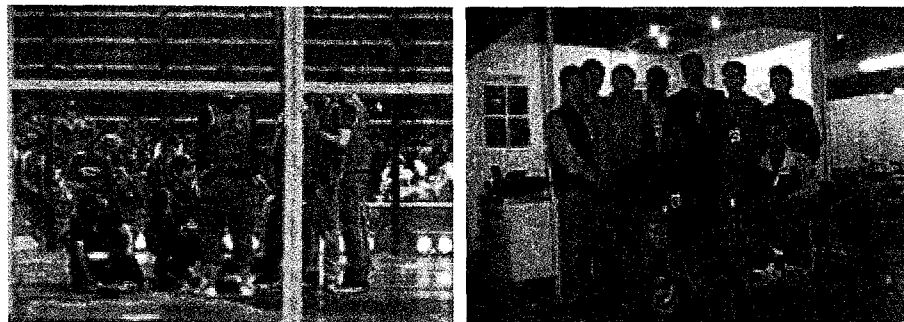
작품 발표회 및 경진대회

기사모에서 생각한 창작 아이디어는 곧바로 작품구현으로 실행된다. 2009년 기사모는 태양광 발전소를 우리의 기술력으로 직접 건설한다는 목표로 추적장치 설치를 위한 콘크리트 타설 작업, 태양광모듈조립공정, 추적 장치 설치공정 등을 학생의 노력으로 완성하였다. 이같은 경험은 산업현장에서 체험할 수 있는 실무경험과 설계실무능력을 습득하는 시너지 효과를 높여주고 있다. 2010년에는 풍력발전장치를 설계 제작하는 미션을 수행하였다.