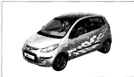
그림 1. i10 전기자동차 컨셉

기아자동차도 같은 이유로 1991년 프라이드 전기자동차와 1993년 세피아, 베스타 등의 전기자동차를 시험제작한 바 있으며 대우자동차의 경우에는 1994년 르망 및 에스페로 베이스의 전기자동차를 시험 제작하였다. 또한 현대는 2001년 산타페EV를 개발하여 미국정부와 하와이에서 시범운행을 실시하였는데 2001년 7월부터 2003년 7월까지 총 24개월에 걸쳐 진행되었다. 투입된 전기자동차는 총 15대로 호놀룰루시, 하와이전력회사, 히캄공군기지, 하와이전기차개발단 등이 참여하였다. 현대는 이러한 시범사업을 통해서 차량 운영과 배터리 충전에 대한 데이터를 습득하는 등 양산에 근접하였으나 미국 내에서 전기자동차의 폐기와 함께 개발을 중단하였다. 그러나 최근 들어 국내 정부, 지자체의 요청에 의해 시범운행에 필요한 전기자동차를 공급하기 위하여 개발을 재개하고 금년 프랑크푸르트 모터쇼에 i10 전기를 선보인 바 있다.