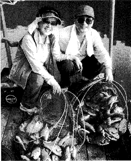
▲ 부인 성정재 여사와 뉘시터에서의 즐거운 시간

는 우리업계의 당면숙제였던 인천항 싸이로 보관요율을 터무니없이 많이 올려 사료업계가 어려움을 겪고 있다고 설명하여 석달동안 풀지 못했던 문제를 원만히 해결했던 기억도 있습니다.