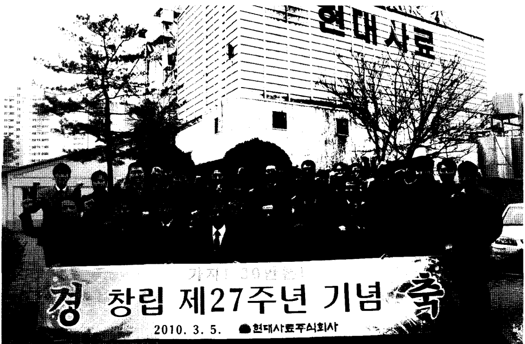
▲ 창립 제27주년 기념식