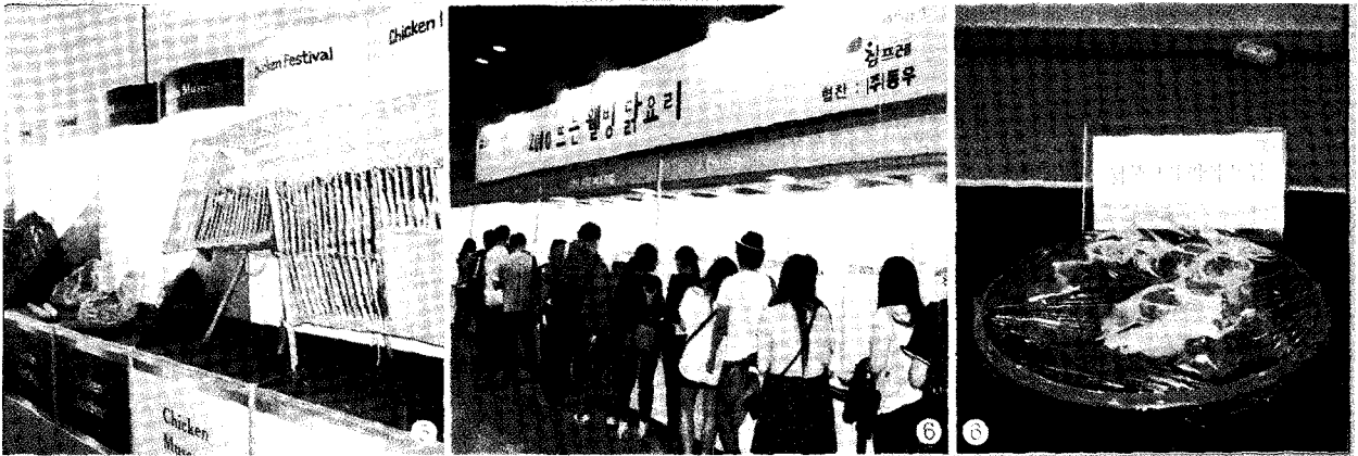
⑤ 치킨 뮤지엄 전시장의 모습 ⑥ 한국식생활개발연구회 2010 뜨는 웰빙 닭요리 시식회 및 전시회

려 닭고기 소비 촉진에 힘쓰겠다'고 포부를 밝혔다. 이번 행사에 참가한 업체들은 다양한 닭고기 메뉴를 선보이며 참관객들의 입맛을 사로잡았다. 하림, 마니커, 동우, 제너시스 등 국내 치킨업계 굴지의 기업들이 대거 참석하여 신제품 홍보 등 시식행사를 진행하여 국내 최초의 치킨 축제다운 면모를 과시하였으며, 28일과 29일 오후에는 참가업체와 참관객이 함께 즐기는 'Chicken Party' 이 개최되었다. 이 이벤트는 하림, 마니커, 배상면주가, 농심, KFC 등에서 신제품 등을 제공하기도 하였다.