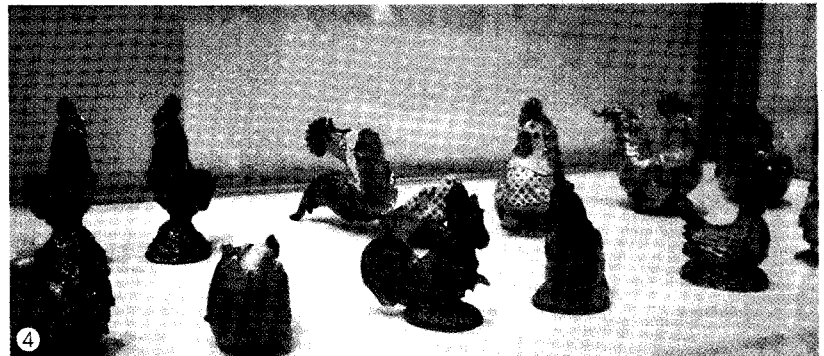
1 행사 참여업체들의 부스 2 닭판짓기 금상 수상작 레서피 3 닭판짓기 수상작들의 레서피가 공개되었다. 4 치킨 뮤지엄 전시장의 모습