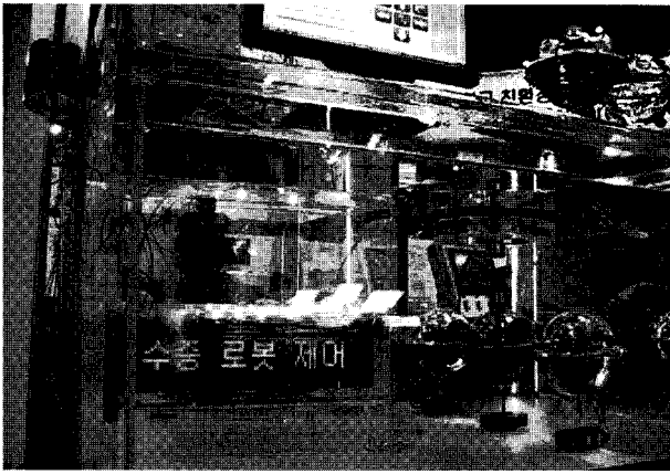
그림 3 수중음파통신을 이용한 수중로봇 무선제어 시연

용 저전력 초음파 모뎀 원천 기술과 RF/초음파 게이트웨이 기술, 노드 관리 기술 등을 개발하였으며 현재 트랜스듀서 및 모뎀의 소형화를 통해 H/W의 성능 향상을 위한 기술 개발과 수중환경에 최적화된 데이터 전송 기법 등을 연구하고 있다. 올해에는 그림 3과 같이 수중음파통신을 이용하여 수중 로봇을 무선 제어하는 기술을 CDMA 기술과 연계하여 ITRC 포럼에 선보이기도 하였다.