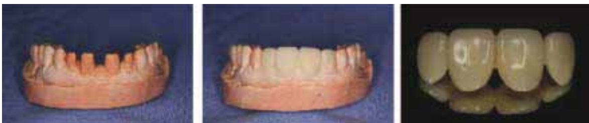
그림 9 동일한 방법으로 진행해서 활택한 표면의 provisional restoration을 제작할수 있다.