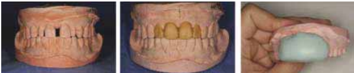
그림 8 동일한 방법으로 진행하고 기공용putty를 이용해 복제한다.