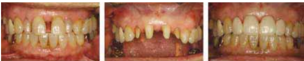
그림 10 환자의 초진상황과 지대치 삭제, 그리고 provisional restoration완성모습이다.