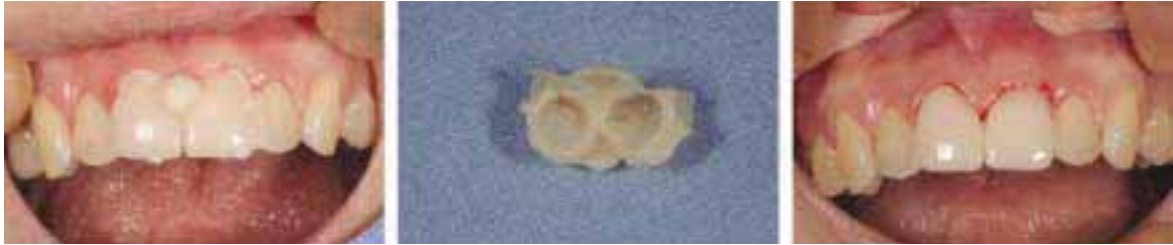
그림 7 연마된 provisional restoration을 구강내에 자가중합레진을 이용, 인기해서 마무리한다

Wax-wash를 시행하고 치료실 과정을 염두하면서 지대치 삭제를 실시한다. 지대치 삭제량이 많아 신경노출이 예상된다(그림 4). 분리제 도포후 자가중합레진을 혼합하여 Dough stage에서 인상체를 이용해 마킹된 부위까지 정확하게 인기하도록 한다(그림 5). 참고로 진료실에서는 해당 치아의 신경치료를 선행하고 지대치 형성을 마무리하였다(그림 6).