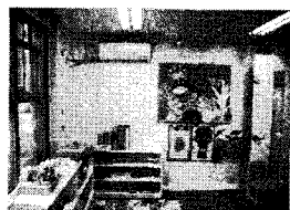
<그림 1> 면적이 협소한 어린이집 <그림 2> 실내가 단조로운 노인정