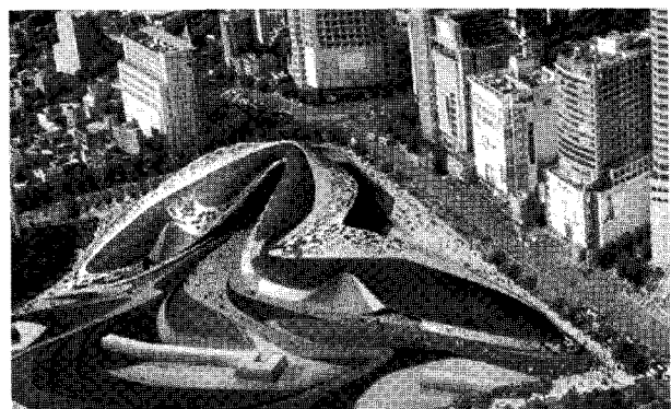
그림 1 동대문 디자인 플라자

SmartGeometry 그룹에 의해 주최되는 각종 활동은 동대문 디자인 파크나 두바이 타워와 같이 현재 건설 환경을 획기적으로 바꾸고 있는 건축과 구조 표현의 새로운 형태