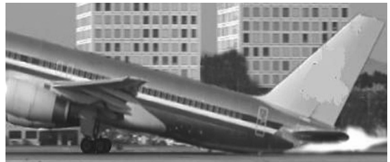
〈그림 1〉 이륙 부양 중 꼬리 지상접촉

비행기는 구조적으로 이륙부양 중 또는 착륙접지 중 꼬리부분이 지면과 가까워지므로 높은 기수자세변화는 준사고에 포함되는 꼬리꺾힘을 발생시키게 되며, 과도한 충격이 있을 경우에는 사고로 이어질 수 있다. 또한 이 경우 여압비행기는 구조적으로 동체하부 후면의 객실여압장치