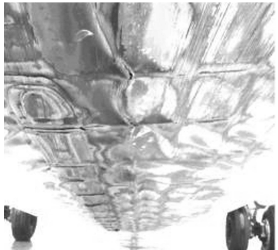
〈그림 2〉 Tail Strike 후 동체 손상

비행기에 탑승자 및 화물 분포가 비행기 무게중심 뒤쪽에 치우칠 경우 Tail Strike 발생 가능성이 커지게 된다.