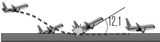
(그림 4) 사례 D의 Tail Strike 발생지점