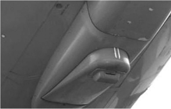
(그림 3) Tail Skid 형상