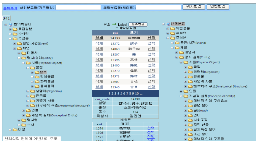
그림 2. 분류 관리 시스템의 화면