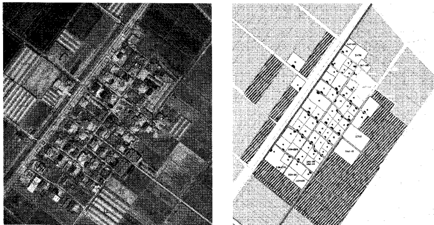
Figure 3 마을내부도로망 공간분석 원도. (사례; 전남 보성군 안심촌 - 간척취락계획지구)

간분석 원도를 작성하였다(Figure 3 참조). 작성된 마을 내부도로망 공간분석 원도를 기본도면으로 조사자가 직접 마을을 방문하여 도로 폭원수준, 포장종류 및 상태, 배수측구 유무 및 위치, 가옥 및 시설의 출입문 위치, 담장 유무 등을 조사하고 실제 도로와 공간분석 원도 사이의 상이한 부분을 수정·보완하였다.