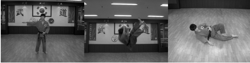
〈그림 2〉 측방낙법 국면