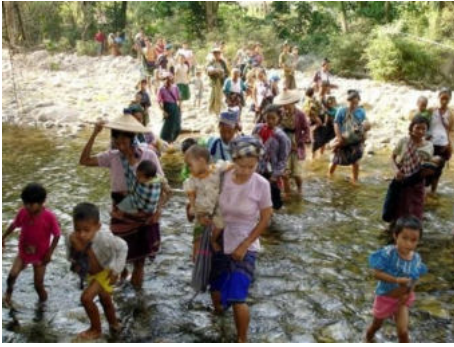
<그림 4> 국경을 넘고 있는 카렌족 난민.