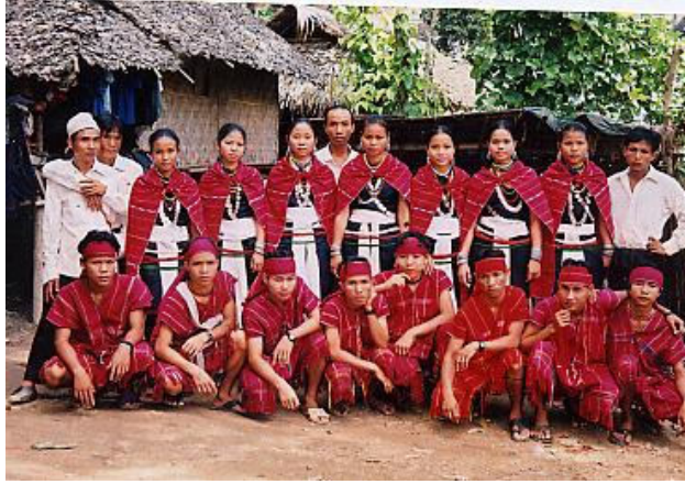
<그림 2> 붉은색의 전통 의상을 착용한 카렌니족. 출처: