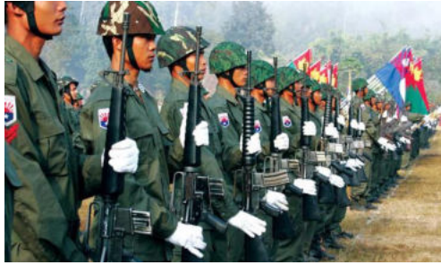
<그림 6> KNDO의 열병 장면.

그러나 이러한 요구는 무산되고 1948년 말에 발생한 카렌족과 버마족의 충돌사건에 이어 미얀마 정부군의 카렌족에 대한 탄압이 시작되면서 KNU는 본격적인 반정부 부장활동에 들어갔다. KNU는 1949년 3월 20일에는 따웅우에서 국명을 ‘꼬톨레(Kawtoolei)’로 하는 독립국가를 정식으로 선포하였고, 그 해 6월에는 카렌족 군사조직을 꼬톨레국군으로 통합하였다. 1952년에 미얀마 동쪽 산지를 중심으로 한 카렌주가 미얀마정부의 헌법 개정에 의해 설치되었지만, KNU는 여전히 에야워디 델타지역이 제외된 점을 들어 협상을 거부하였다. 1962년부터 본격화된 미얀마 정부군의 KNU에 대한 지속적인 총공세는 KNU의 존립 자체에 대한 위기까지 몰리게 되었다. 게다가 KNU를 제외한 여타 소수종족 반정부 무장조직의 대부분이 미얀마 정부와 평화협상을 체결한 상태여서 더욱 고립의 상태가 가중되었다.