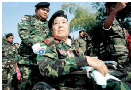
<그림 7> KNU의 수장 보미야.

<그림 7>에서 보이듯이 1968년 반정부 활동을 전개했던 보미야(Bo Mya)장군이 카렌족을 재정비하고 강력한 지도력을 발휘하며 70년대와 80년대를 거치면서 약 1만 명에 가까운 병력을 보유하는 등 KNU는 반정부 군사조직의 최대 규모로 성장하였으나(Smith 1994:44-45), KNU 내부에서 빚어져 왔던 지도부와 하급 장교들 간의 종교적 갈등과 지속적인 미얀마정부군의 대공세 등으로 인해 KNU의 존립은 항시 위