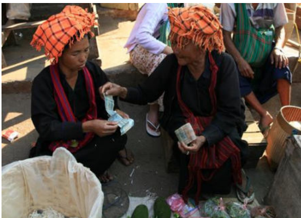
<그림 1> 북부 산(Shan)주의 수도 따웅지(Taunggy)에 거주하는 빠오족 여인들의 모습.

이와 같이 당시 언어의 차이에 따른 카렌족의 하위종족 분류는 매우 다양하고 복잡하며 이러한 카렌족 종족성의 느슨함으로 인해 미얀마의