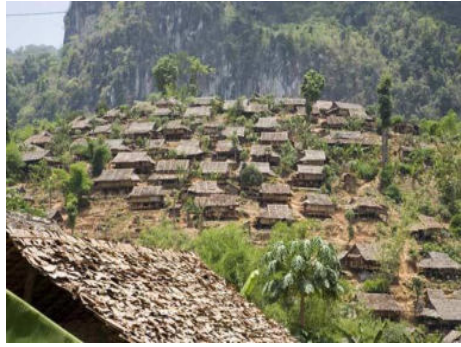
<그림 5> 미얀마-태국 국경지대의 카렌족 난민촌 모습.

또한, 1996년 이후 미얀마 군사정부는 소수민족 반정부 무장집단의 배후지로 여겨졌던 미얀마 동부 산지의 정부통제권 강화를 위하여 대규모의 정부군 병력을 파견하였고, 군사작전에 방해가 된다고 여겨지는 민간인 거주지를 강제로 이주시키는 정책을 자행하였는데 이때에도 수많은 카렌족이 강제 이주 당하였다. 2006년 한 해에만 약 76,000명이 강제 이주를 당하였고, 그 중에서 주로 카렌주와 버고(Bago) 지역에 거주하고 있는 약 43,000명의 카렌족들이 집단 이주를 당하였다(TBBC 2007). 이렇게 강제 이주된 카렌족 난민들은 태국음식을 먹고 태국어를 능숙하게 구사하기도 하는 등 미얀마 내 거주하는 카렌족 집단과 언어적 측면, 생계경제 유형, 의식주의 양상 등 문화적 측면에 있어서 많은 차이를 나타내고 있다. 이러한 양상은 현대에 있어서 카렌족의 종족개념을 이해하는 데에 혼란스러운 요소들이 되고 있다.