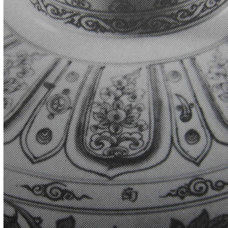
<그림 4> 그림 3의 어깨 부분의 칠보문

그리고 모란당초문을 기조로 어깨의 상부에는 원말이나 명초의 짧은 기간에 사용된 칠보문(七寶文)이 시문되어있다. 칠보문은 중국 및 한국에서 보이는 칠보문보다 양식화되었지만 칠보문의 존재만으로도 15세기의 베트남의 청화백자가 14세기말이나 15세기전반의 중국 청화백자로부터 많은 영향을 받았던 사실을 알려주고 있다. 6) <그림 4>