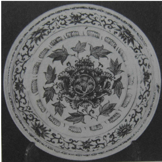
<그림 5> 이집트 푸스타트유적 출토 <그림 6> 이란 아르데빌미술관소장의 베트남 청화백자반의 베트남 청화백자