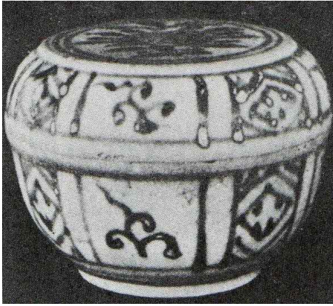
<그림 7> 필리핀 루손출토의 베트남 청화백자