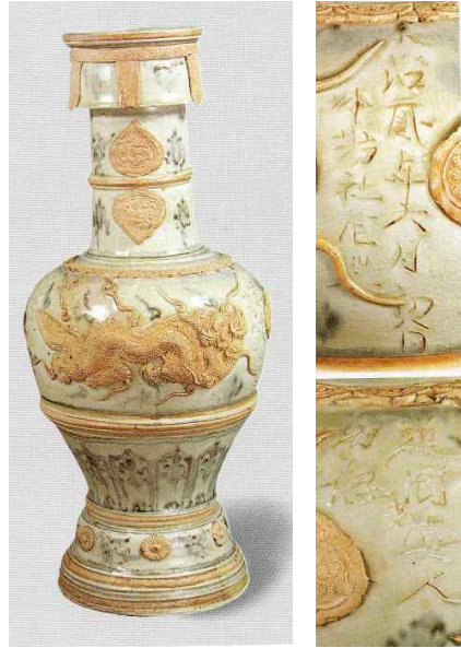
<그림 8> 베트남청화백자 향로, 1677년, 동경국립박물관 <그림 9> 그림 8의 명문부분

청화백자를 실어 인도네시아를 거쳐 유럽에 반입하는 해상 무역의 네트워크를 확립하게 된다. 그리고 이러한 해상네트워크에서 인도네시아 바타비아(Batavia)는 무역중계지로서 대단한 역할을 수행한다.