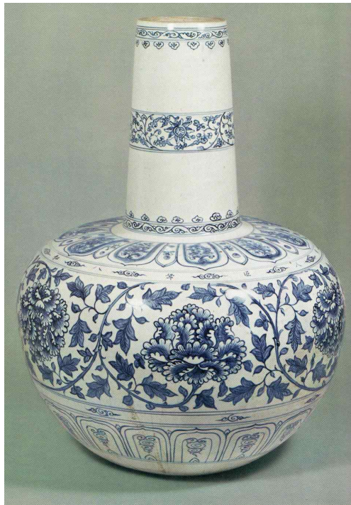
<그림 3> 터키 톱카피박물관소장, 베트남 청화백자병(1450년)

두 번째로 명문의 삭주(策州)는 15세기중엽의 베트남 청화백자의 제작지로 추정되어, 15세기 베트남 청화백자가 항구에서 가까운 삭주에서 제작된 사실을 알 수 있다. 삭주는 앞의 베트남