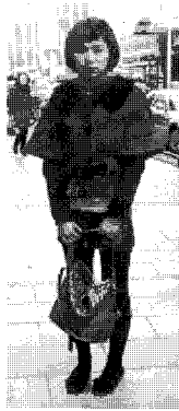
<그림 3> 복고풍 정장(엔지)