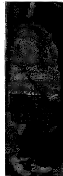
<그림 23> 걸리쉬(상하이)

분적으로 에스닉한 이미지를 사용하여 일상적으로 착용하기에 부담이 없는 차림이 대부분이었다(그림 18)-(그림 20). 특히 프린지 장식이나 손뜨개 머플러가 가장 많이 이용되었다. 색상은 아이보리, 검은색, 회색, 브라운 색이 보편적이고 노란색, 파랑색의 선명한 색상들도 일부 사용되었으나, 소수민족의상을 연상시키는 원색조의 의상들은 거의 찾아볼 수 없었다.