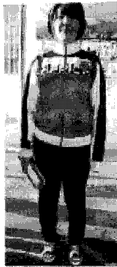
<그림 9> 스포티(옌지)