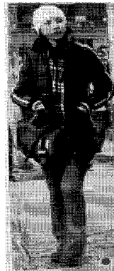
<그림 10> 스포티(상하이)