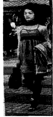
<그림 14> 페미닌(상하이)