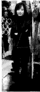
<그림 13> 페미닌(엔지)