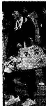
<그림 22> 걸리쉬(베이징) 자료출처: 姦25. (2008, 10), p. 60.