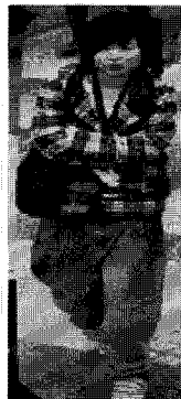
<그림 25> 일본풍(베이징)