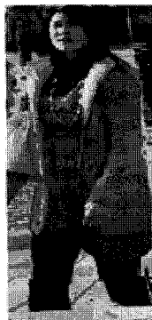
<그림 34> 믹스드(베이징)