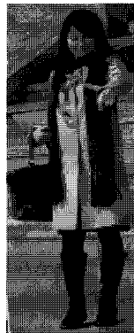
<그림 4> 비즈니스 정장(베이징)