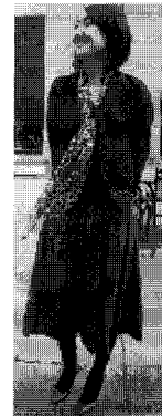
<그림 5> 정장(상하이)

커다란 주머니가 달린 작업복 형태의 긴 점퍼, 짧은 코트 등 유행을 의식하지 않는 캐주얼의 기본적인 아이템들을 조합하여 입었으며 실루엣은 허리를 강조한 사례는 드물고 주로 몸에 여유있게 맞거나 품이 넉넉한 일자형 실루엣이 많아 편안한 느낌을 전달한다. 신발은 주로 운동화와 낮은 구두, 무릎길이나 발목길이의 부츠 등 비교적 여러 종류를 신었다.