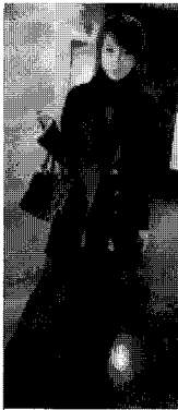
<그림 2> 비즈니스 정장(엔지)