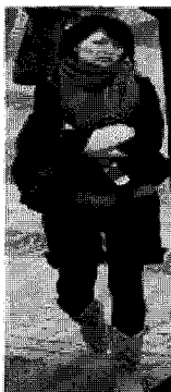
<그림 27> 트렌디(엔지)