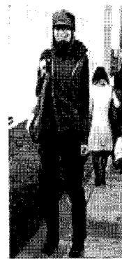
<그림 32> 밀리터리(상하이)