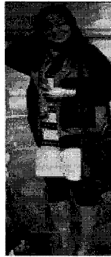
<그림 19> 에스닉(베이징)