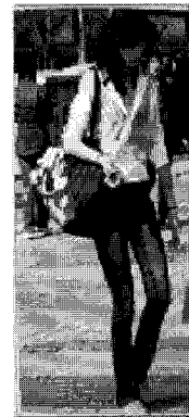
<그림 8> 이지(상하이)