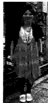
<그림 26> 일본풍(상하이) 자료출처: 중국 스트리트 패션. (2008, 9). www.sfc.seoul.kr