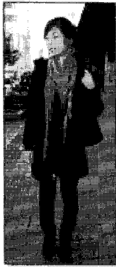
<그림 6> 이지(옌지)