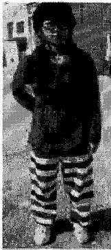
<그림 24> 일본풍(엔지)

벌키 캐주얼은 손으로 찬 듯한 굵은 니트의 긴 코트나 헐렁한 긴 카디건, 품이 넓은 스웨터들을 바지와 함께 착용한 스타일로 전체적으로 부피감이 느껴진다. 일자형 실루엣과 함께 다른 캐주얼 유형에 없