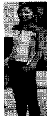
<그림 11> 스포티(베이징)

운동복으로 입는 아이템을 상의로 입고 하의로는 청바지나 짧은 바지, 트레이닝 바지 등과 함께 입는 스타일이 대부분이었다. 특징적인 것은 아디다스 라인이라고 하는 삼선(세 줄) 무늬가 셔츠, 점퍼, 바지에 보이고, 운동선수 번호나 기호, 스포츠단 로고들이 새겨져 있는 디자인이 많다는 점이다(그림 9)-(그림 11). 액세서리로는 야구모자나 운동화를 신어 전체적으로 스포티한 이미지를 전달하였다. 방수, 방습, 방한을 위해 코팅된 천이나 패딩소재가 많이 이용되었다. 색상은 검은색, 흰색 외에도 다른 캐주얼에 비해 파랑, 노랑, 빨강, 분홍 등 밝고 선명한 색상들이 많아 전체적으로 밝고 경쾌한 분위기를 전달한다.