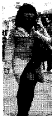
<그림 31> 벌키(베이징)