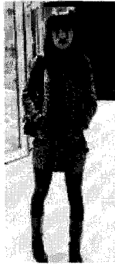
<그림 15> 섹시(엔지)