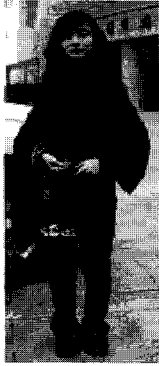
<그림 18> 에스닉(옌지)