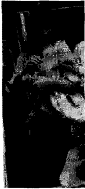
<그림 12> 페미닌(베이징)