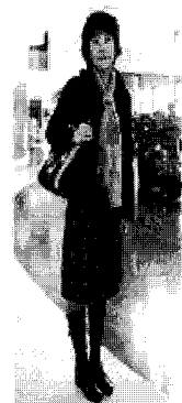
<그림 20> 에스닉(상하이)