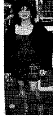
<그림 17> 섹시(상하이)

례가 많이 발견되었다. 베이징과 상하이에서는 각자의 개성에 따라 전체적으로 여성적인 분위기이나 여러 가지 다른 스타일을 보여주었다. 특히 상하이에서는 길이가 발목까지 오는 긴 레이스 니트 또는 미니 드레스를 입어 독특한 실루엣을 보여주고 있다.