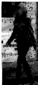
<그림 28> 트렌디(베이징) 자료출처: 25. (2008, 11), p. 30.