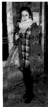
<그림 33> 믹스드(옌지)