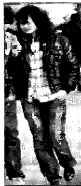
<그림 7> 이지(베이징)