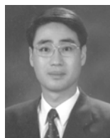
김 태 진

논문접수 : 2010.09.06 수정일 : 2010.10.22 심사완료 : 2010.10.30