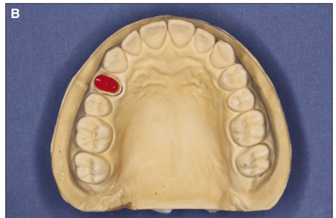
Fig. 2. Working model in this study. A: lateral view, B: occlusal view.