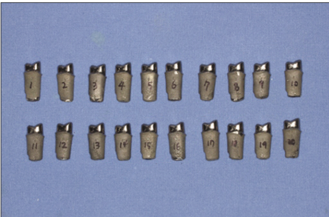
Fig. 1. Metal dies.