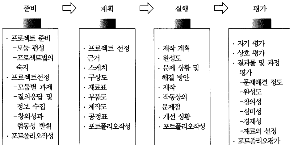
[그림 4] 제안된 프로젝트법의 모형

이 연구에서는 고등학교 기술·가정과 ‘에너지와 수송기술’ 단원의 과제 수행 학습으로 ‘창의적인 자동차 만들기’ 수업에서 적용된 프로젝트법의 모형을 설계하였다. 이 모형은 Kirpatrick 모형과 한국 교육과정 평가원(2003)의 모형을 참고하여 준비, 계획, 실행, 평가의 4 단계로 구성된다. 이 연구에서 제안한 프로젝트법 모형을 나타내면 [그림 4]와 같다.