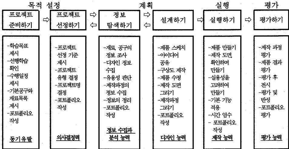
[그림 2] 한국교육과정평가원의 프로젝트법 모형

젝트법 모형을 제시하였다. 이 모형은 Kirpatrick의 모형을 보완하여 기술적 활동을 통해 산출물을 제작하는 데 적절하도록 구체화하였다는 특징이 있다. 한국교육과정평가원이 제시한 프로젝트법 모형은 [그림 2]와 같다.