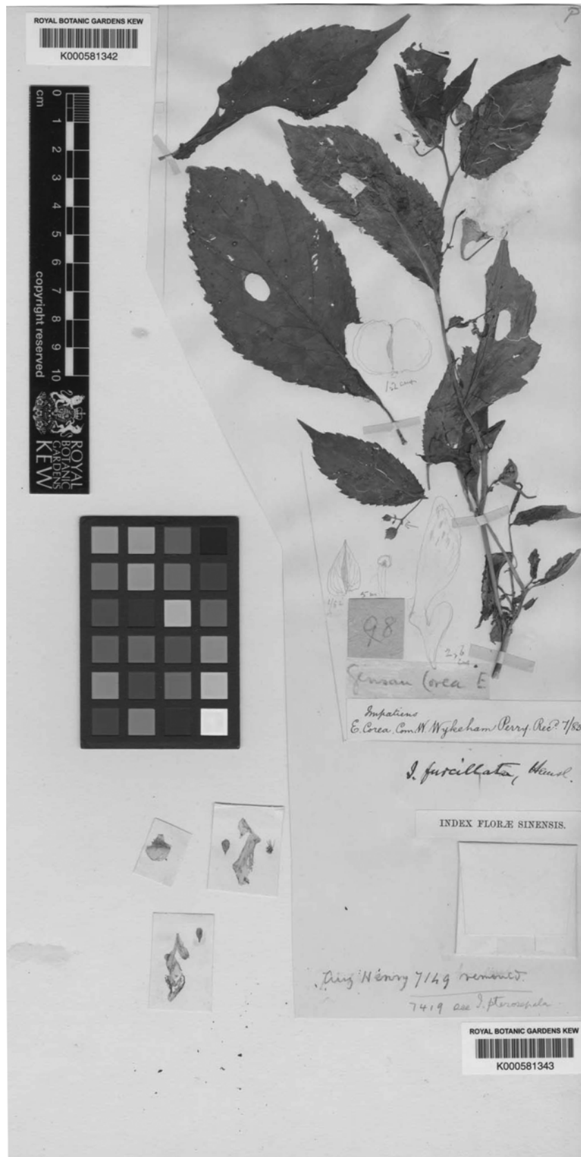
Fig. 2. Type specimen (Perry 98) of Impatiens furcillata Hemsl.