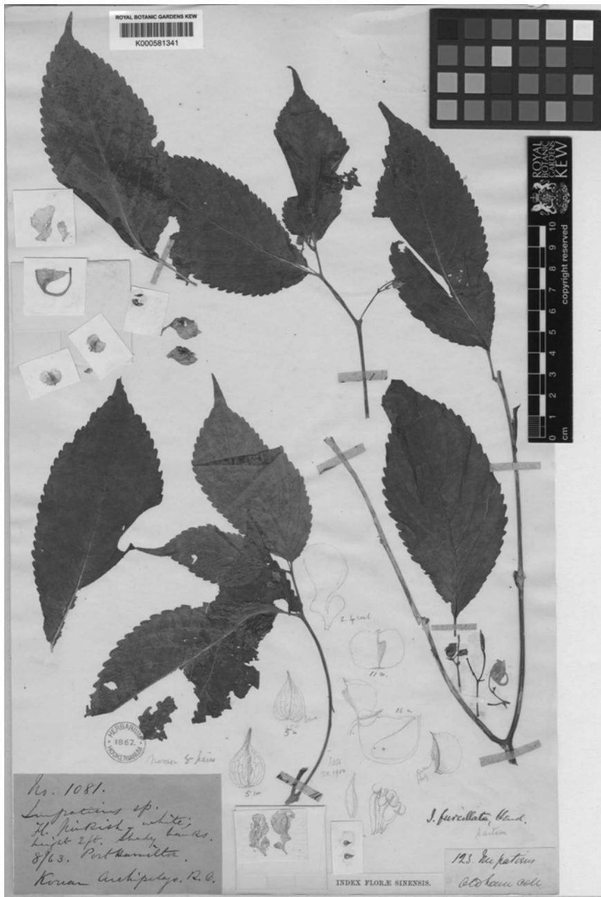
Fig. 1. Type specimen ( Oldham 123 ) of Impatiens furcillata Hemsl.

Impatiens kojeensis Y.N. Lee, Korean J. Pl. Taxon. 28: 28, 1998. Type: Korea, Gyeongsangnam-do, West south side of Isl. Koiedo, 6 Oct. 1997, Y. Lee, S. Cho and J. Kim s.n. (holotype: Herbarium of Korea Plant Research Institute, not seen)