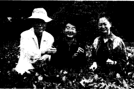
2005년 중국 운남성 차 원산지 방문

보고 되어 있습니다. 안전 사용기준을 지켜 사용하면 농약은 소기의 목적을 달성한 후 여러 경로로 분해되어 농약으로서의 역할을 잃어버리게 됩니다. 따라서 안전사용기준을 준수하여 농약을 사용하도록 철저히