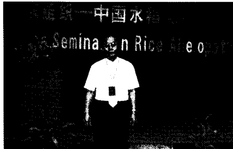
2007년 FAO-Chia 세미나 참석

산업의 핵심자원입니다. 단순히 먹거리 생산만이 아니라, 농촌 '어메니티(amenity)'를 새로운 패러다임으로 정하여 정책에 반영하여야 할 것입니다. 농촌특유의 자연환경과 지역문화 등 사람들에게 쾌적성과 만족감을 주는 '어메니티'를 잘 보존하고 유지하는 것이 바로 정부의 녹색성장 정책이 될 수 있을 것입니다.