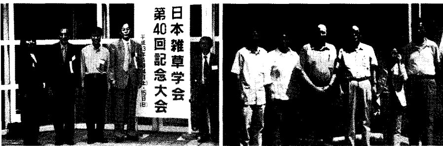
2001년 일본 잡초학회 40주년 기념대회 참석(좌) 2007년 호주 왈스스투드대학 프레트리 교수와 함께(우)