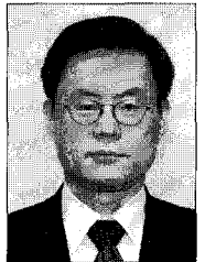
김재수 청장 농촌진흥청