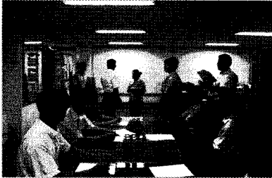
행사에 관한 건