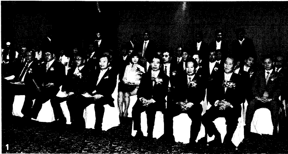
1 2009 인쇄문화의 날 수상자들 2 국민의례를 하고 있는 귀빈들의 모습 3 정두언 의원이 축사를 하고 있다 4 유인촌 문화체육관광부 장관이 방명록을 적고 있다 5 행사장에서는 신종플루 예방을 위한 조치가 취해졌다 6 이충원 회장이 건배를 제의하고 있다