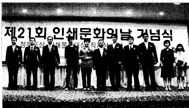
◇ 모범근로자부문 수상자들