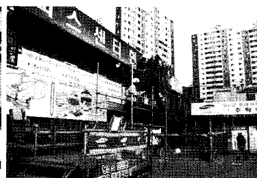
• 마네킹 추락 체험교육