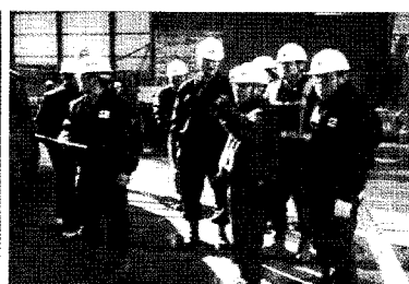
• 현장 자율안전점검단 활동