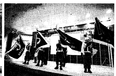
• 본부별 무재해기 출정식