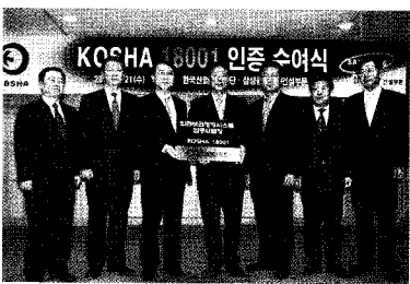
• KOSHA 18001 인증 수여식