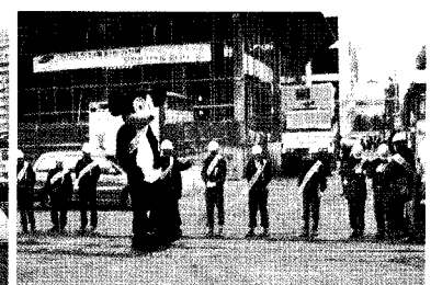
• 웃음 안전캠페인