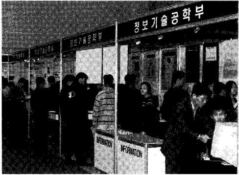
〈졸업프로젝트 전시회 모습〉

이러한 교육을 통해 졸업생들은 작품의 기획, 재료구입, 제작, 발표 및 평가의 모든 과정을 직접 체험할 수 있으며 별도의 재교육 없이 바로 실무에 투입되어 각 분야에서 제 역할을 할 수 있게 된다. 또한, 타 학과 전공교수와의 협력교과과정을 통해 전공에서의 한시성을 탈피할 수 있고 복합적인 문제 제시 및 해결능력, 협동정신, 창의력 등을 배양할 수 있다.