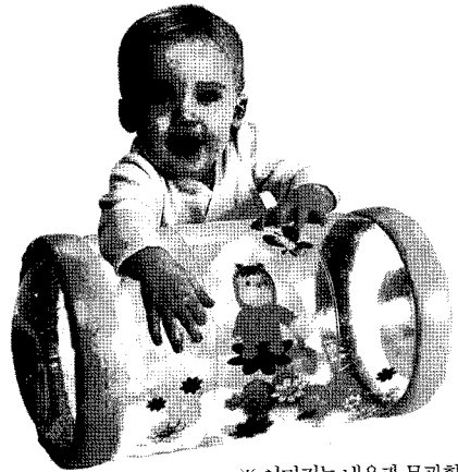
※ 이미지는 내용과 무관함

※ 미국기준(ANSI Z80) : 패션용(70%이상), 일반용(95%이상), 특수용(99%이상)