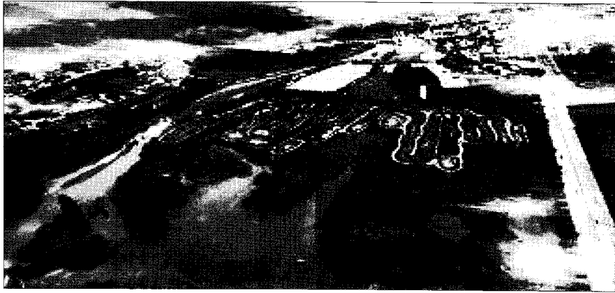
〈그림 5〉 경안천 하류 인공습지 조감도

동이였다. 다행히 최근 환경부와 경기도 팔당수질개선본부 가 함께 대책을 협의하고 있다. 조만간 좋은 성과가 있을 것 으로 기대하고 있다.