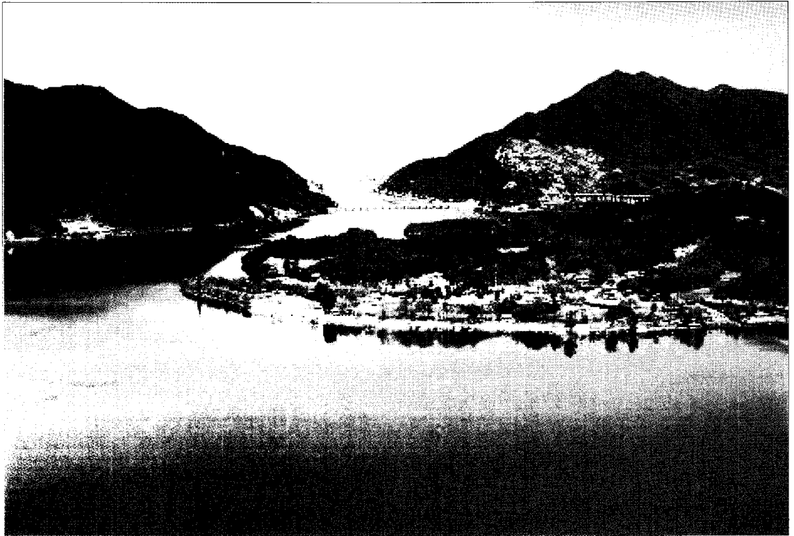
〈그림 3〉 팔당호 전경