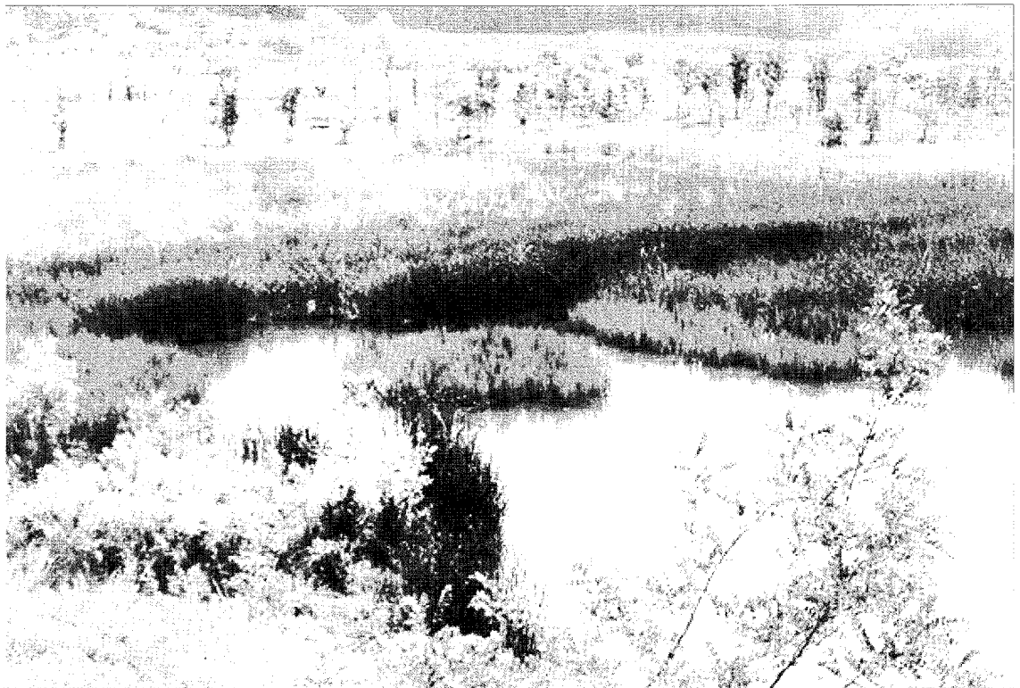
〈그림 4〉 경안천 습지