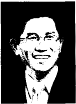
김문수 | 경기도지사