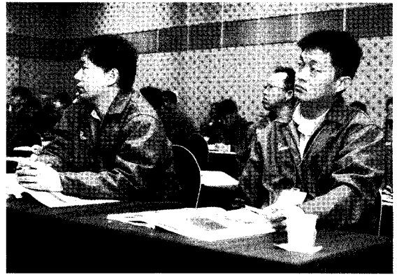
• 교육에 열중하고 있는 교육 참석자들.