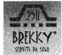
▲ 25H Brekky 로고 및 자동판매기