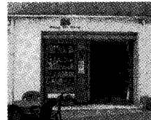
◀ 24Shop No Stop 자동판매기 내부 및 외부 설치 전경