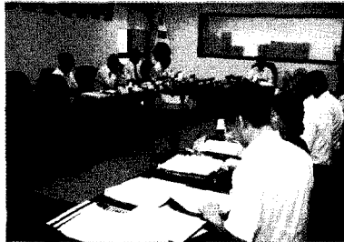
후보자 선정에 관한 건 - 지식경제부·국토해양부 장관 및 서울시장 표창 후보자 선정에 관한 건