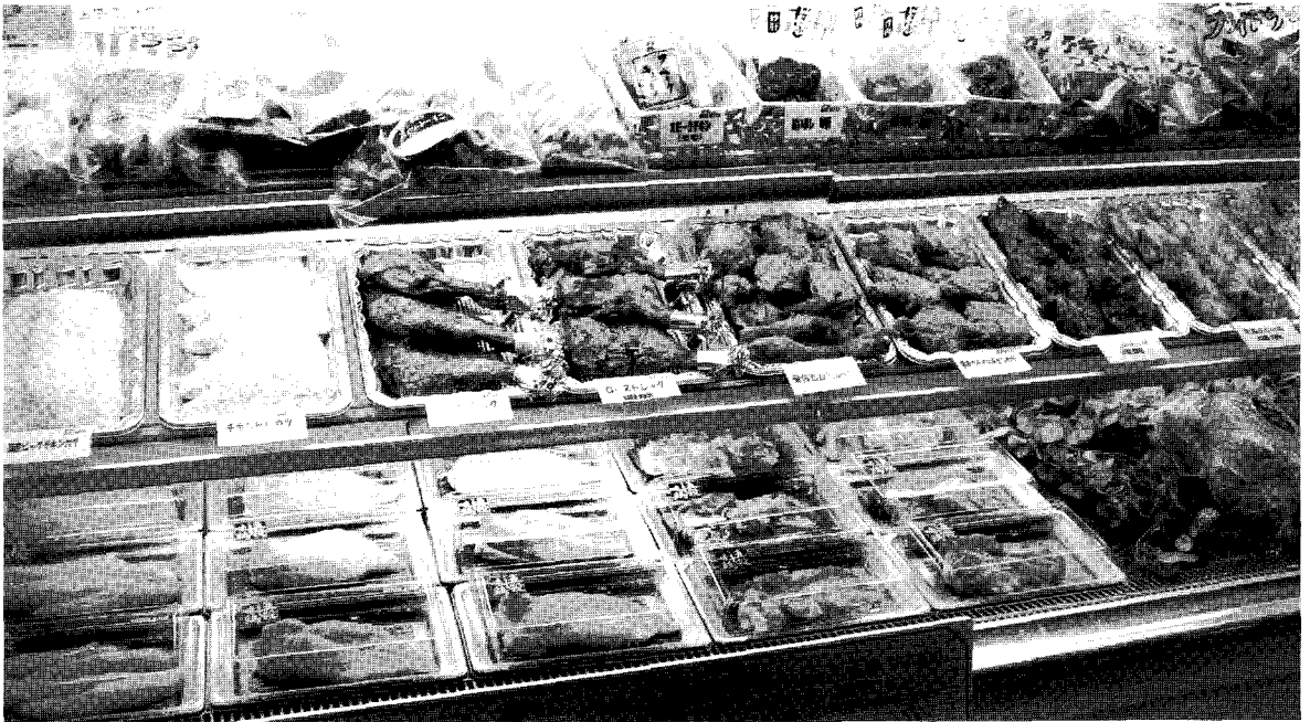
▲ 일본의 다양한 가금육 및 가공제품

방육을 생산하기 위한 육종 프로그램이 진행되고 있으며, 말레이시아와 싱가포르의 화교 시장을 타겟으로 지방 함량이 낮은 2원 교잡종 (2-way hybrids mule ducks) 실용오리가 공급된 바 있다. 계속 내 콜레스테롤 함량을 낮추기 위한 다양한 영양학적 연구 결과를 오리 연구에 벤치마킹 하는 시도도 필요하겠다.