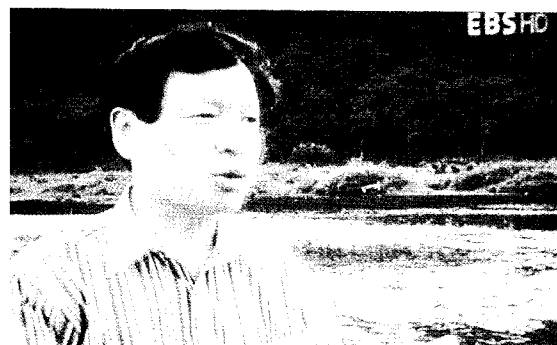
〈그림 4〉 필자 EBS 하나뿐인 지구 〈은어의 고향 영덕 오십천〉에 출연하여 현지에서 은어의 생태를 설명하는 필자