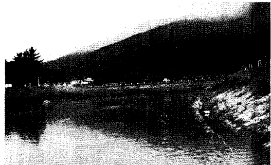
〈그림 2〉 삼진강 우리나라에서 은어가 가장 많이 사는 삼진강. 이곳은 강의 종류로 은어가 산란과 모천을 찾아갈 때 지나가는 주요한 거점이 되고 있다. 은어서식 하천복원 계획 시 은어 생태에 대한 전문가의 자문이 반드시 필요하다.