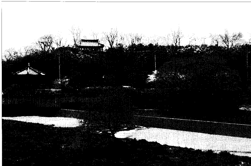
〈그림 4〉 함평천 영수보