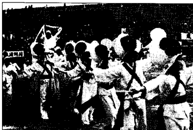
(그림 5) 기산제

이 지역 사람들은 함평천의 물줄기와 더불어 살아오면서 다양한 문화를 일구어냈다. 함평천 수변공원을 중심으로 약 100만㎡의 들녘에서 매년 4월말 열리는 기산제는 옛부터 한해의 풍년농사를 감사하고 지역화합을 위하여 지내 온 전통적인 문화유산이다. 함평지역의 전통문화 계승·발전, 지역경제 활성화, 주민화합 등을 위해 거행되는 영수제, 사직제와 더불어 함평의 3대 제향중 하나이다. 기산제는 한해의 풍년농사를 감사하고 지역화합을 위하여 거행되어 왔으나, 일제 강점기인 1920년대 말 민족문화말살정책으로 인하여 맥이 끊긴 후, 1979년부터 약식 불교산제로 다시 거행되던 '기산제'를 1984년 10월 4일 군민의 날 행사시 기산제를 재현한