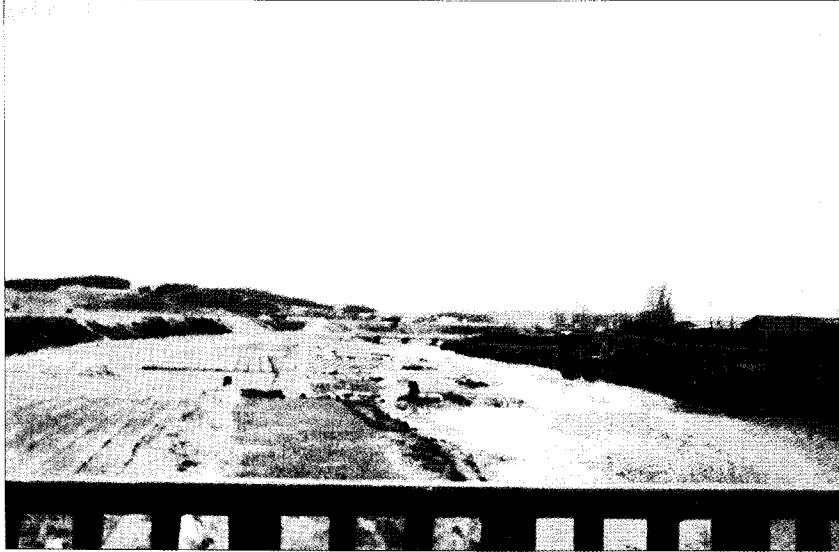
〈그림 3〉 함평천의 들녘 모습(1980년대)