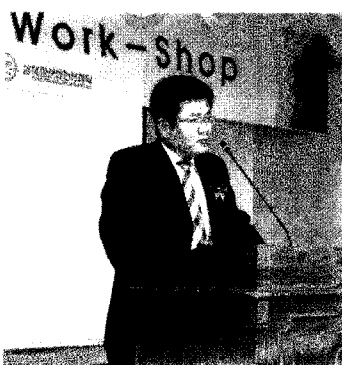
김윤배 대전지방노동청장 축사

오늘 이렇게 충청지역 건설업 안전분야 관계자분들, 김윤배 대전지방노동청장 등 노동부 관계자분들과 함께 건설업에서 발생하고 있는 산업재해 예방을 위해 함께 협력해 나가기 위한 자리를 마련할 수 있어 기쁘게 생각합니다. 그동안 산업재해 예방을 위해 각 주체에서 다양한 정책과 기법들이 연구되고 시행되어 왔지만 지난해 건설업에서 발생한 사고성 사망자는 592명으로 타 업종보다 높으며 특히 추락재해로 468명이 아까운 목숨을 잃는 등 아직도 많은 재해가 발생하고 있는 실정입니다. 제가 인도안전협회의 초청으로 문바이에 방문했을 때 아파트 신축공사 현장을 방문할 기회가 있었는데, 현장의 근로자들 중 안전모와 안전화를 신고 작업하는 경우가 극히 드물고 안전시설도 제대로 갖춰져 있지 않았습니 다. 우리나라의 경우 많은 안전관계자분들의 노력으로 큰 발전이 있었던 것은 사실이나 선진국과는 많은 차이가 있다고 생각합니다. 이런 자리를 통하여 정부와 유관기관, 기업의 안전관계자 분들이 모여 건설업 산업재해 예방을 위해 지혜를 모으고 실천할 수 있는 방안이 모색되길 기대해 봅니다.