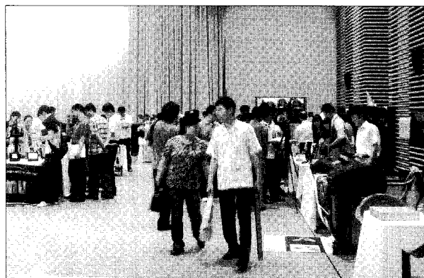
▶지난 6월 16일 서울 신도림 테크노마트 11층에서 열린 2009 디지털포토포럼 및 사진기자재전이 열렸다.

스튜디오 및 미니랩 현상소 운영자와 신규 창업자를 대상으로 한 2009 디지털포토포럼 및 사진기자재전에서는 포토북 및 미니앨범, 앨범 및 액자, 의상 및 소품, 스튜디오 조명, 출력 장비 및 미디어, 모니터, 편집 소프트웨어, 카메라 액세서리, 팬시상품 등 스튜디오 장비를 총망라해 전시했다. 포토북 및 미니앨범 부문에선 ▲ 한국HP IPG-건식 미니랩 프린터 'HP 포토스마트 MLI1000', HP 포토센터 4.1, HP RPS(Retail Publishing Solution) ▲ 송화시스템기술(주)-포토북 제작 시스템 '픽토리' ▲ T&ST-유니바인드 포토북 제본기 ▲ 한국후지필름(주)-토털 포토 서비스 '후지 포토매니저 시스템', 포토북 샘플 ▲ 이탈리아인터내셔널-접착식 미니앨범 제작 솔루션 ▲ 엔터스튜디오-디지털 포토 상품 제작기, 명함 제작기, 재단기, 평판프린터, 템플릿(유치원앨범) 등이 출품됐다.