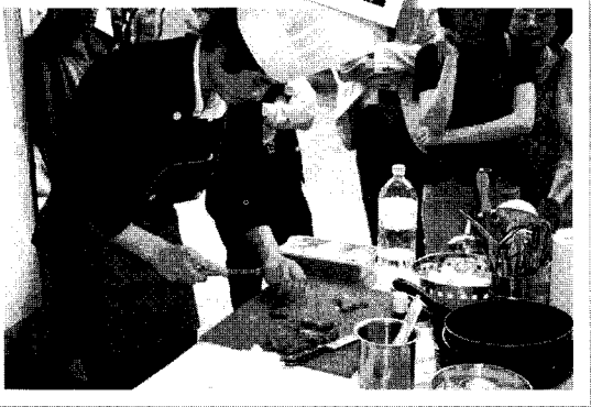
▲ 요리블로거 육우요리 대항전에 참가한 참가자들