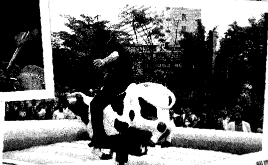
◀ 올해도 인기를 모은 로데오 게임