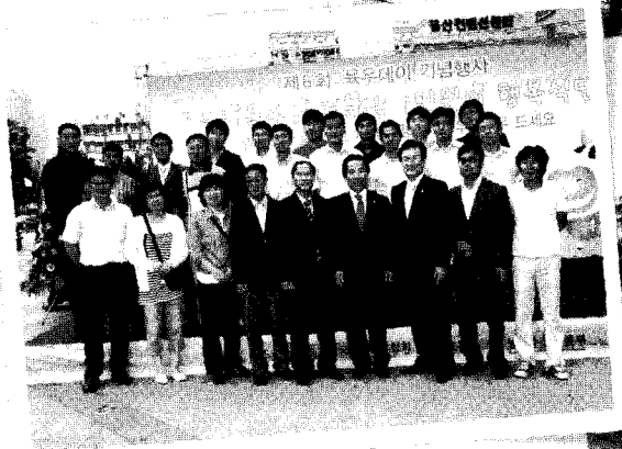
▲ 충원지역 유우농가들의 기념촬영