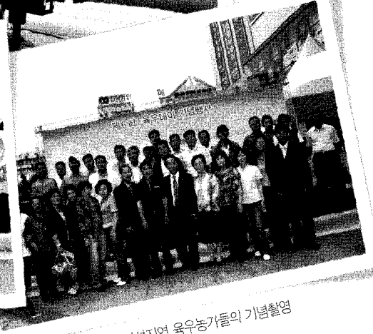
▲ 안성지역 유우농가들의 기념촬영

의 관심이 그 어느 때보다 높은 상황에서, 국내에서 생산되어 품질과 안전성이 보증되면서 가격은 상대적으로 저렴한 국내산 유우가 가장 실속있는 선택"임을 강조하였다.