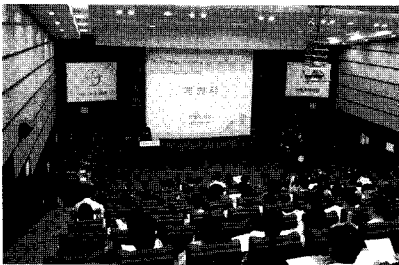
제3회 반려동물 Zoonosis 심포지엄

우리회에서는 지난 6월 14일(일) 13:00~17:10 건국대학교 산학협동관에서 제3회 반려동물 Zoonosis 심포지엄을 개최하였다.