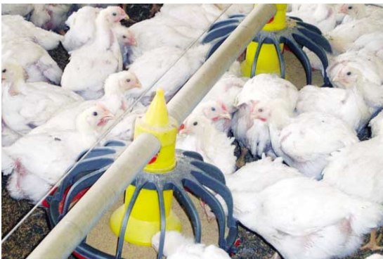
사료 급여 방법에 따라 사료요구를 향상에 기여하는 효과가 우수하다고 검증되었다.