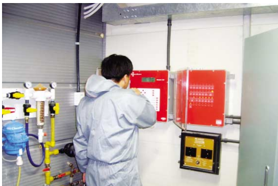
급이 방식은 급이기 컨트롤이 가능하도록 조정하여 농장에 맞도록 매뉴얼하면 효과적이다.