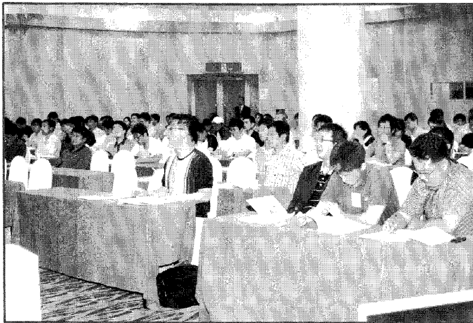
▲ 교육생들의 표정이 사뭇 진지해 보인다.