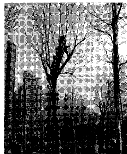
작업 실행 모습