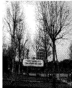
시연 전 양버즘나무(우측)

우리 협회에서 산림청 연구용역으로 수행중인 “가로경관 향상방안 연구”와 관련하여 가로수 수형관리 현장시연회를 2009년 3월 30일(월) 오후 2시에 서울 보라매공원에서 개최했다. 가로수 수형관리 현장 시연회를 통해 목표수형에 따른 관리기술을 전파하고, 일선 현장 담당자들의 의견수렴으로 가로수 수형관리의 발전적 대안을 모색하기 위한 이번 시연회는 김자영 회장님과 김용환 책임연구원 외 연구자와 산림청 관계자, 지자체 가로수 업무 담당자 등 총 60여명이 참석하였다. 보라매공원에 식재되어 있는 양버즘나무 1본을 천안연암대학에서 목표수형을 정한 후 1차의 강한 전정작업과 2차의 약한 전정작업(새순정리)으로 나누어 작업하였다. 금년 6~7월경 가지발달 과정을 검토한 후 가지정리를 하고, 10월경 가지 발달 결과에 대해 시연회를 개최할 예정이다.