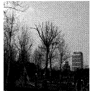
시연 후 양버즘나무