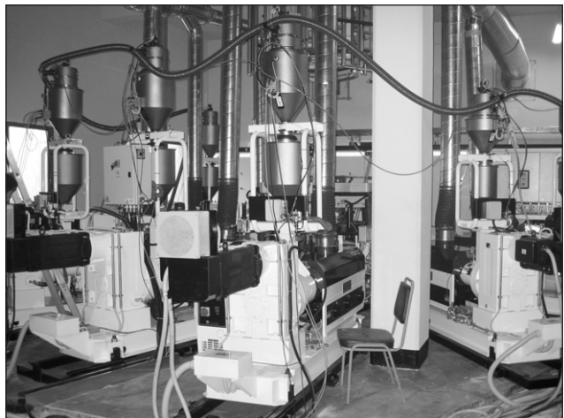
▲ 새로 도입된 7Layer

국내의 치열한 경쟁보다는 해외시장을 공략해 필름을 통한 세계화를 이루어 내겠다는 전략이 주효해 생산물의 80%를 수출하고 20% 가량만을 내수에 판매하고 있는