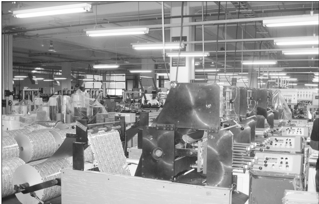
▲ 고품질 제품을 생산하고 있는 대원산업 현장

대원산업이 이렇게 설비 확충에 주력하고 있는 것은 세계시장이 요구하는 고품질 제