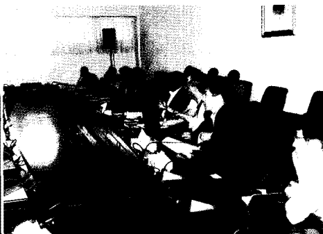
malanje주 지사 사업설명