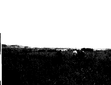
판자노르테주의 루칼라시에 사업부지 확정