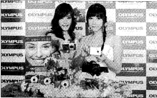
▶모델들이 인물사진을 뚜렷하고 맑게 보정해 꽃보다 화사하게 촬영할 수 있는 '뷰티모드' 및 '아트필터' 기능을 탑재한 신제품들을 선보이고 있다.