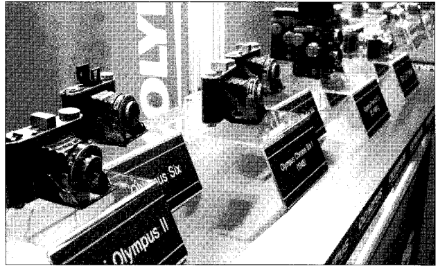
▶행사장 한쪽에는 올림푸스 90년의 역사를 한 눈에 볼 수 있는 다양한 카메라 제품이 전시됐다.

컴팩트 디카 신제품은 신개념 인물촬영·보정 기능인 '뷰티모드'를 제공, 눈동자는 뚜렷하게, 피부는 부드럽게 묘사해 준다. 뷰티모드는 간단한 모드 다이얼을 통해 설정 후 사용할 수 있으며, 사진 촬영 후 카메라에 내장된 편집기능을 통해 자동으로 이미지를 보정해 준다. 이 밖에 최대 16명 얼굴인식 기능 외에도 인물촬영·야간촬영·스포츠촬영 등 다양한 상황에서 인물사진 최적의 촬영조합을 찾아주는 인텔리전트 오