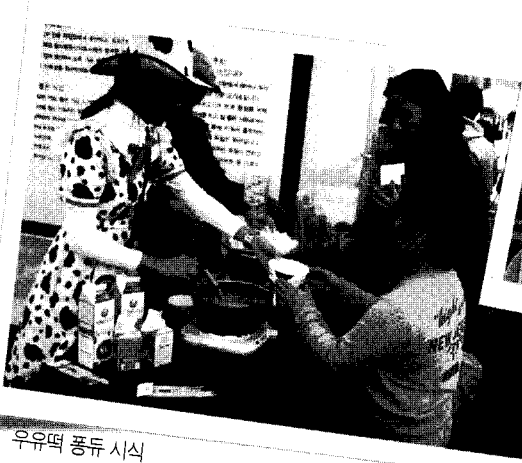
우유떡 풍류 시식