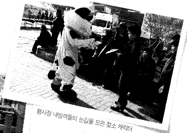
행사장 내방객들의 눈길을 모은 젖소 캐릭터