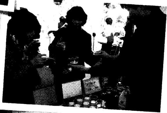
우유카테일 코너의 모습

제 14회 농업인의 날 행사가 '꿈에 Green 녹색성장, 함께 Green 농촌사랑' 이란 주제로 개막하여 지난 11월 11일부터 12일, 양일간 수원 농협 하나로마트 앞에서 펼쳐졌다.