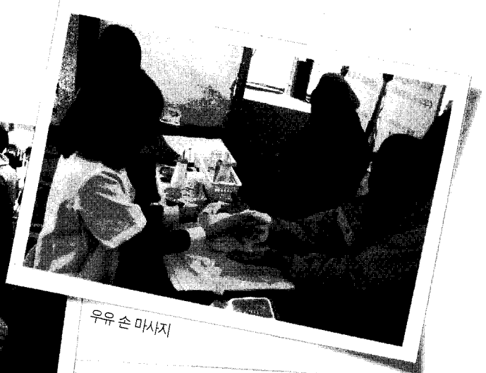
우유 손 마사지