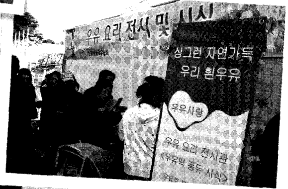
남녀노소로 붐비는 시식코너

또한 우유피부마사지 코너는 기존의 먹는 홍보에서 벗어난 새로운 시도로 특히 주부연령층에게 좋은 반응을 얻어 행사 장소를 고려한 적절한 타깃공략이 주요했음을 보여주었다.