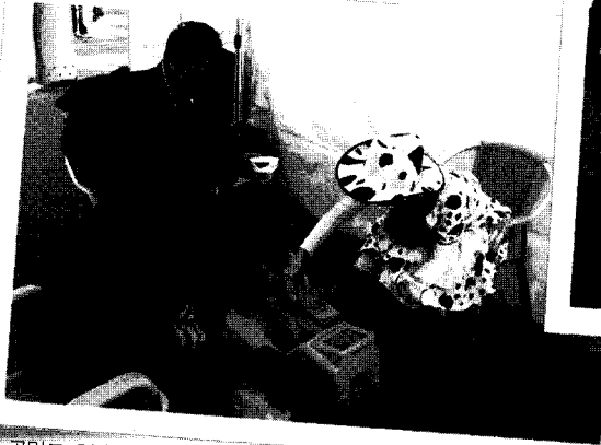
꿀밀도 측정 코너