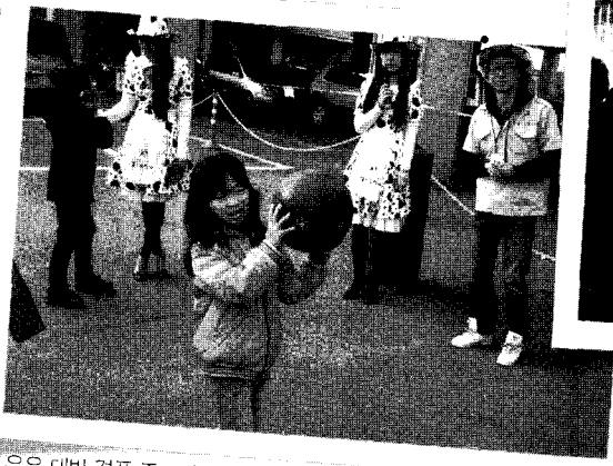
우유 대박 경품 존 모습