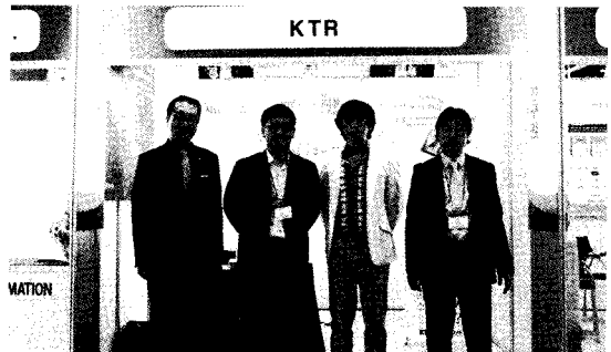
[사진] KES 2009(한국전자전)에 참가한 한국화학시험연구원(KTR)

KTR은 Green IT ZONE에서 열린 2009 REACH 등록 엑스포에 (주)패로스연구소, 국제환경규제 기업지원센터 등을 비롯한 REACH 전문 상담기관들과 참가하여, REACH 제도 소개와 최신동향, 해외 인증 및 해외규제 관련 상담, REACH SVHC(고위험성물질)에 대한 상담을 실시하였다.