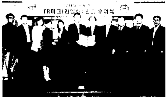
[사진] TR마크(라벨링) 인증 수여식 후 기념촬영