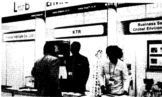
[사진] REACH 관련 기업 상담을 실시하는 KTR

이번 한국전자전은 휴대폰, 반도체, 디스플레이 등의 국내 관련제품 전시회와 함께 첨단제품 시연회, 컴퓨터 패션쇼, 유명연예인 한국산 IT제품 체험 이벤트 등 다양한 볼거리를 제공하였다.