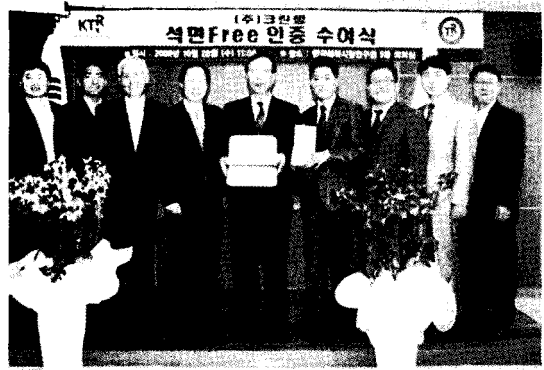
[사진] 석면Free 인증 수여식