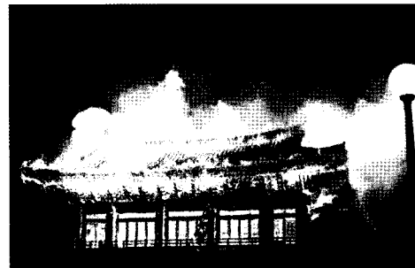
지붕까지 불에 휩싸인 모습