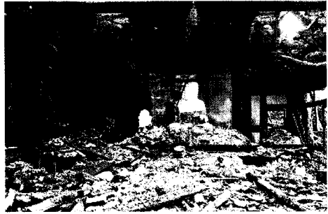
대웅전 소실 모습