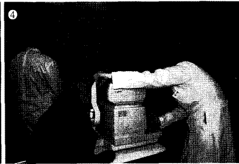
4 안과검진을 실시하고 있는 관계자.