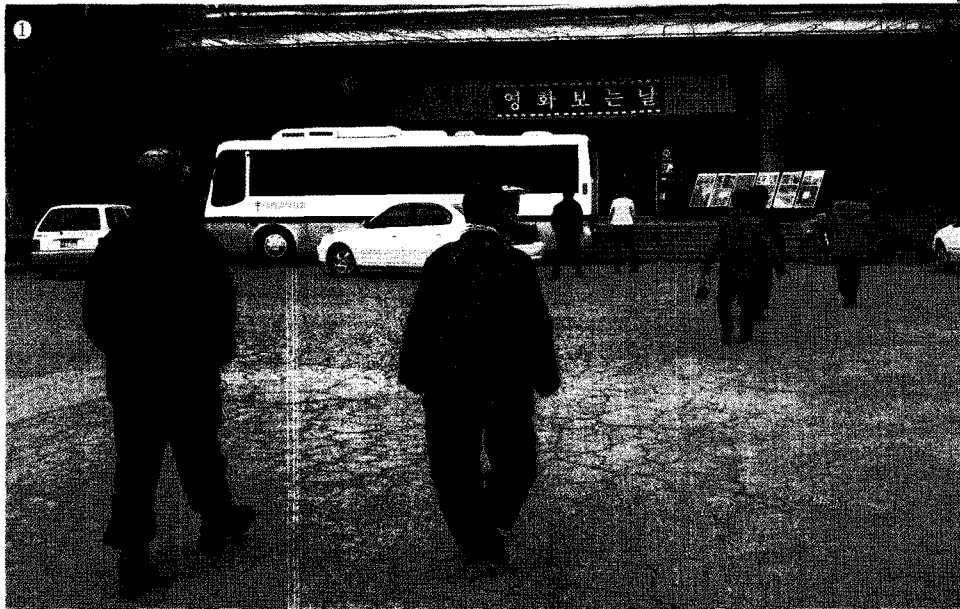
담양군보건소와 대한결핵협회가 함께하는 검진을 받기 위해 삼삼오오 몰려드는 주민들.

대나무의 고장, 연인들의 필수 데이트 코스 메타세쿼이아 길, 담양 하면 떠오르는 이미지들이다. 최근 여기에 한 가지를 더 추가해야 될 것 같다. 바로 담양군보건소가 2007년도부터 한국실명예방재단의 지원을 받아 실시하는 '노인 안(眼)검진 및 개안수술' 프로젝트다. 주민들의 열띤 호응 속에서 실시되고 있는 담양군보건소의 안검진 프로젝트는 최근 들어 점점 다각화되는 보건소의 건강정책을 엿볼 수 있는 사례다.