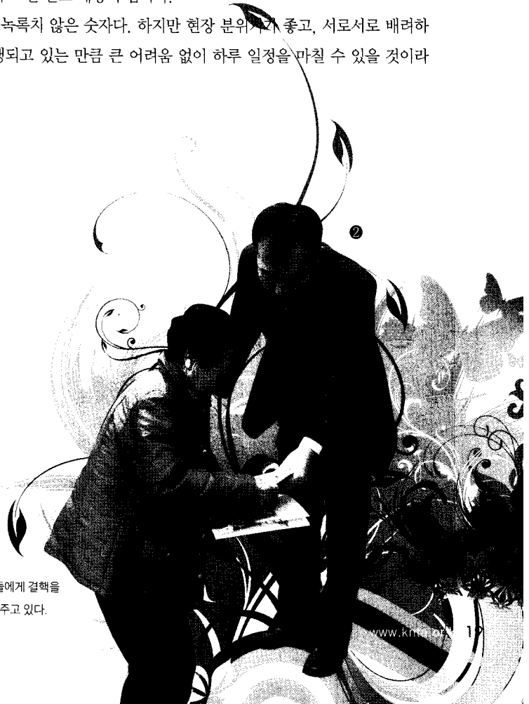
② 엑스레이검진을 실시하고 나온 주민들에게 결핵을 알릴 수 있는 홍보물과 불편을 나누어주고 있다.

600명 정도라면 결코 녹록치 않은 숫자다. 하지만 현장 분위기가 좋고, 서로서로 배려하는 가운데 검진이 진행되고 있는 만큼 큰 어려움 없이 하루 일정을 마칠 수 있을 것이라고 관계자는 설명했다.