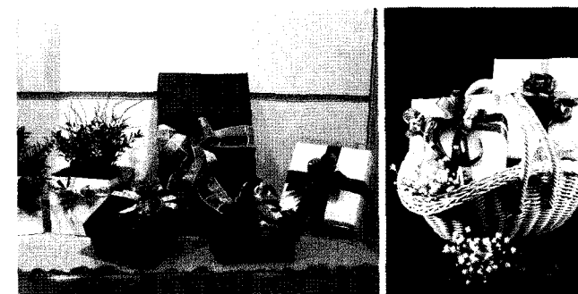
▲ green memory(좌), 조성경팀 작품(우)

작가 : 조성경(한국선물포장협회상임이사), 배광숙(한국선물포장협회이사) ☺