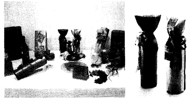
▲ 와인카페공(좌), 이복현팀 작품(우)