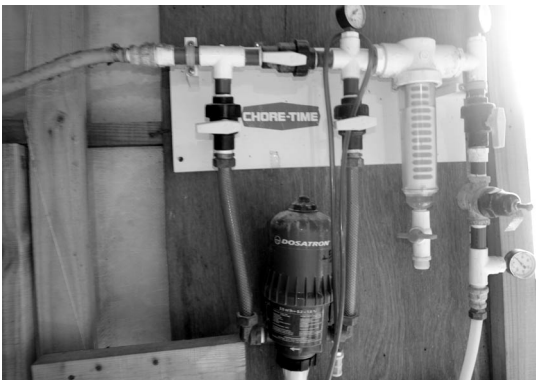
▲ 보배농장의 자랑거리 중 하나인 음수분배기

사람들은 투자를 하지 않으면서 사양 성적이 좋길 바라는데 가능하다면 그것이 가장 좋은 방법이겠지만 결코 쉬운 일은 아닐 것이다.