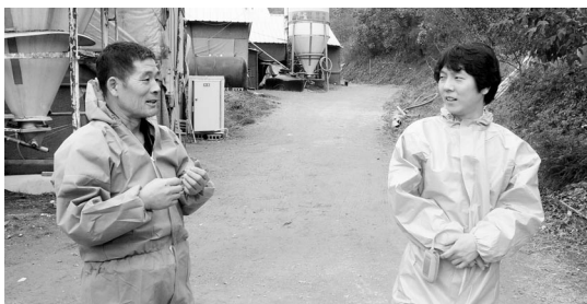
▲ HACCP 인증 심사를 받을 때의 모습

만 남았다. 종계장과 부화장들도 HACCP 인증을 받으면 농장에서는 믿고 병아리를 받을 수 있으며, 검증된 병아리를 받는 것이야말로 농장에서 최고로 바라는 것이다. 건강한 병아리를 들임으로써 더욱더 위생적이고 안전한 고품질 닭고기를 생산할 수 있는 밑바탕이 되는 것이다.