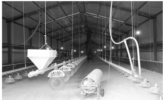
▲ 입추를 앞두고 깨끗하게 정리된 계사

기 시작했으나 처음 키운 닭들은 출하시기에 이르러 수해로 인해 모두 다 떠나려 가버렸다.