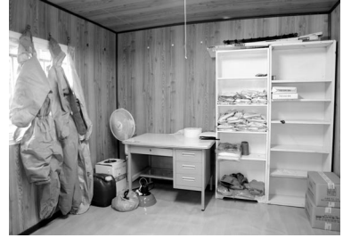
▲ 물품반입창고, 사람 이외의 모든 물품은 농장으로 들어가기 전 필히 이곳을 거쳐야 한다

리' 다. 실제 차단방역 시설을 통해 AI 등의 각종 질병을 사전에 차단한다. 일례로 물품반입창고를 만들어 농장에서 쓰는 약품 등의 반입품은 이곳에서 24시간 자외선 소독 후 농장에 들어갈 수 있도록 해 질병 감염을 사전에 차단했다.