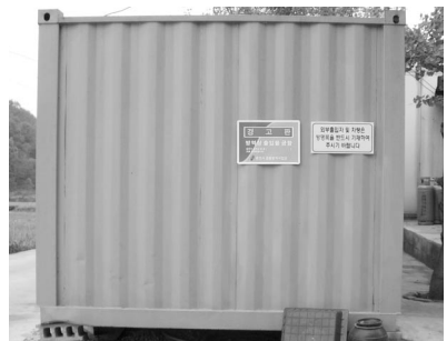
▲ HACCP 관리 현황판이 꾸며져 있는 상황실과 물품반입창고

보배농장은 현재 계열사 닭을 키우고 있다. 출하시기면 회사에서 자체적으로 항생제 잔존유무를 확인한다고 한다. HACCP를 준비하면서 왜 이것이 중요한 것인지 절감하게 되었기 때문에 이제는 무항생제 축산물 인증을 추가로 받겠다는 목표를 세우고 있다.