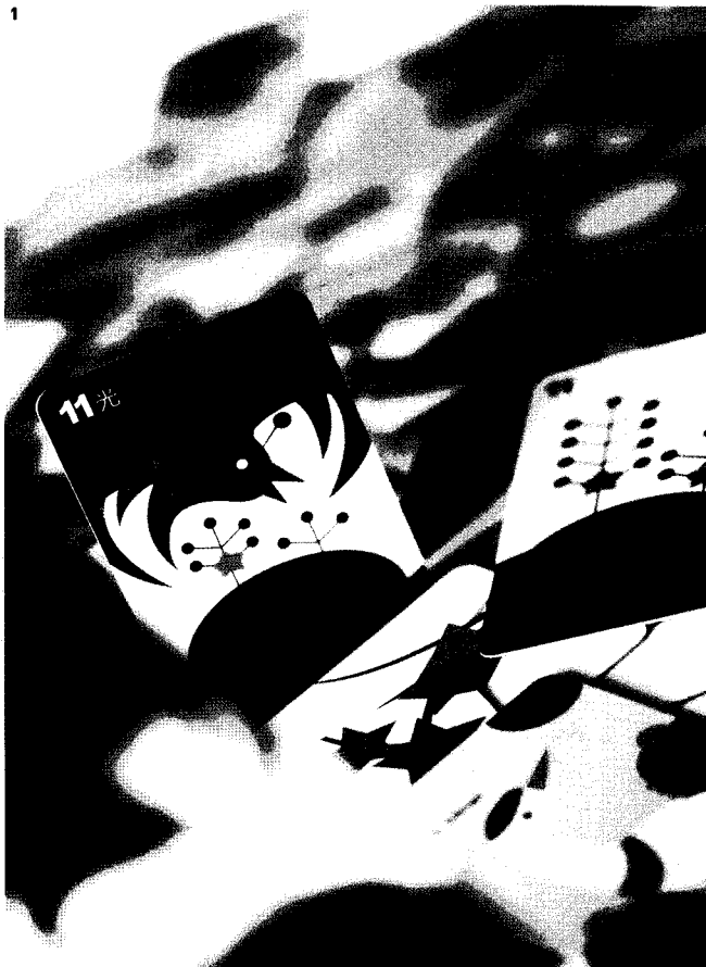
1 독특한 디자인으로 인쇄된 용쟁화투 2-3 한국적 이미지를 넣어 만든 한누리 화투

화투는 48장으로 구성돼 있다. 그러나 요즘 화투는 '조커'라 불리는 6장이 포함돼 54장이 한패로 구성된다. 조커 6장은 지역이나 취향에 따라 다르게 사용된다. 과거와 달리 이들 조커 때문에 고스톱은 막판 대역전이 가능한 더욱 흥미진진한 놀이가 됐다.